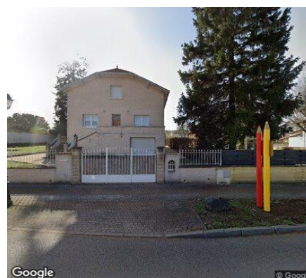
Vue STREET VIEW du secteur